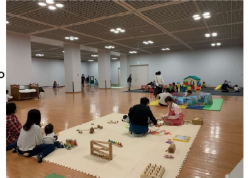
※2019年のキッズホール

飛驒センターでは、以前に好評を得ていたキッズホールを開催致します。キッズホールは、空調の効いた開放的な室内空間を無料でご家族に利用していただくものです。準備している遊具などは以前と少し変わりますが、涼しいお部屋でゆっくりお子様と遊んでください。ご来館の際には、下記の「皆さまへのお願い」をご一読ください。