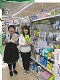
ナチュラルクリーニンググッズ 飛騨で1番品揃え豊富！ 桐生町のバックボックスさん