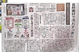
中日新聞・リンネル特別掲載 NHKすくすく子育て出演等